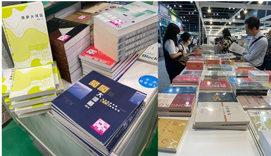
第32届"香港书展"早前圆满结束，以大湾区为主题的书籍，吸引不少有意到大湾区创业及发展的公众驻足，了解大湾区的最新发展领域。

适逢今年是香港回归祖国25载，由三联书局出版，立法会议员李浩然博士撰写的《数字大湾区·香港回归25年》，以客观数据及理性分析，呈现大湾区11座城市的全貌。李博士认为，数字是客观而实在，大湾区城市各有独特优势和分工，可以发挥协同效应，与世界各地其他湾区比较，粤港澳大湾区人均收入是美国三藩市湾区的五分之一，反映未来发展潜力无限，"以香港为例，检测及认证服务获国际信赖及认可，内地产品若要打入国际市场，质量控制(Quality Control)是不可或缺。数据和经验告诉我们，香港在这方面具有特别优势。"