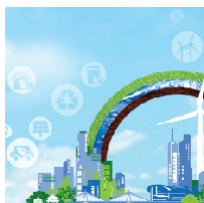
2022年12月14至17日 国际环保博览 2022