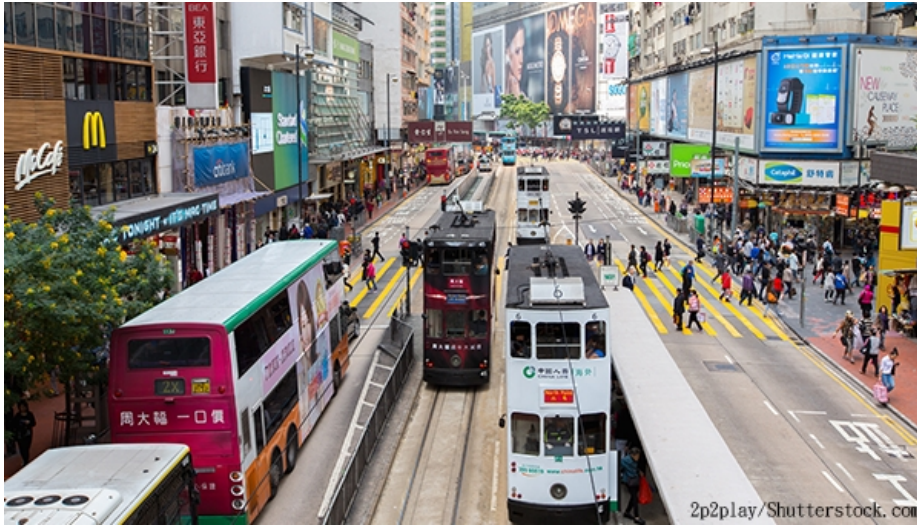
策略性研究将宏观检视香港交通系统布局，促进香港各区发展，进而与大湾区其他城市的交通联系。